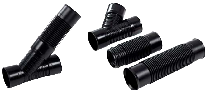
Taipuisa muhvikulma ja -haara SN8