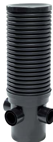
Salaojan tarkastuskaivo yhteillä