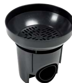
MX-Rännikaivo SVK 300/100-110 mm