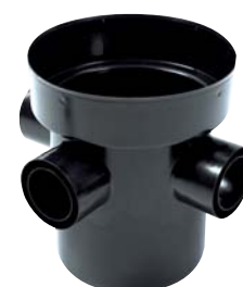
Tarkastuskaivon pohjaelementti yhteillä