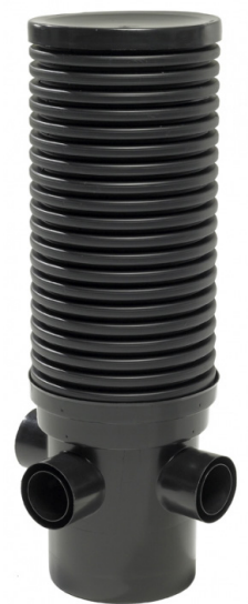
Salaojan tarkastuskaivo yhteillä