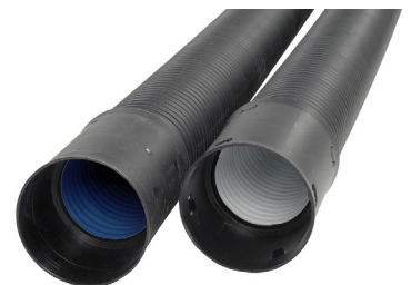
Tuplasalaojaputki ja tuplasadevesiputki