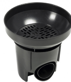
MX-Rännikaivo SVK 300/100-110