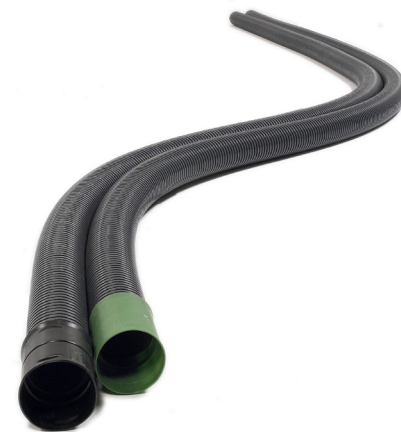
Taipuisat salaoja- ja sadevesiputket