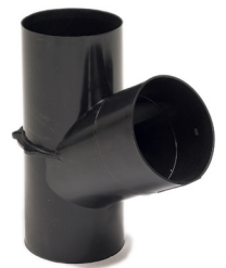
Y-haara 110/110 SN8